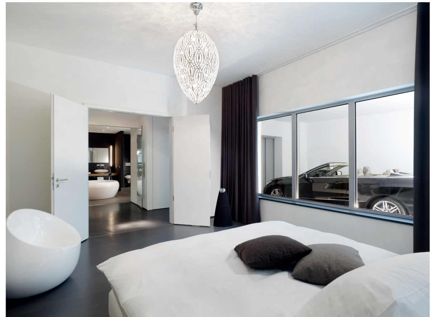
Im CarLoft im 1. OG blickt man vom Schlafzimmer sowohl in das luxuriöse Bad als auch auf den Parkbereich mit Auto