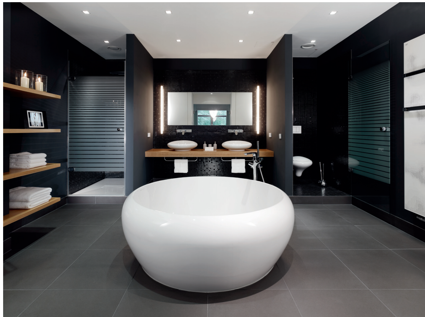
Das Bad wurde mit Produkten der Serie Istanbul von VitrA ausgestattet