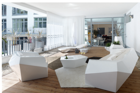
Blick vom Wohnraum auf die Terrasse mit der VONDOM FAZ Collection